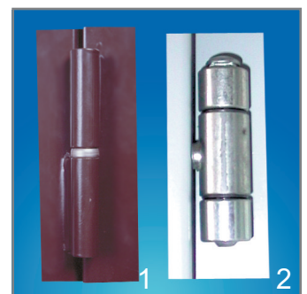
Тип 1 HW